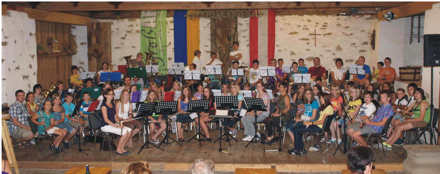
Abschlusskonzert im Musikantenstadel der JTKP Großschönau