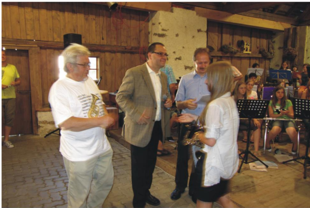
Überreichung der Seminarzeugnisse