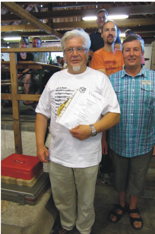
Der jüngste Seminarist freut sich über sein Zeugnis